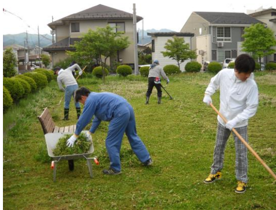
「あかねヶ丘公園の清掃活動」

昨今、主要メンバーが自身の町内会の組織に組み込まれる世代となっており、対応できる人員も減少してきている状況ではありますが、2025年度は数回の参加がありました。