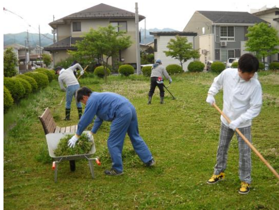
「あかねヶ丘公園の清掃活動」

(2017年2月10日、山形市を美しくする運動推進委員会(会長 山形市長)から、多年にわたる地域美化活動に対し功労表彰を受賞しています。)